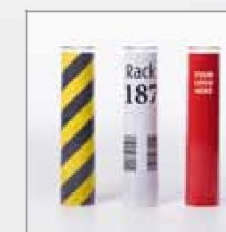
Przezroczysty + wkładka papierowa z informacją