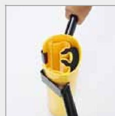
Urządzenie mocujące RackBull